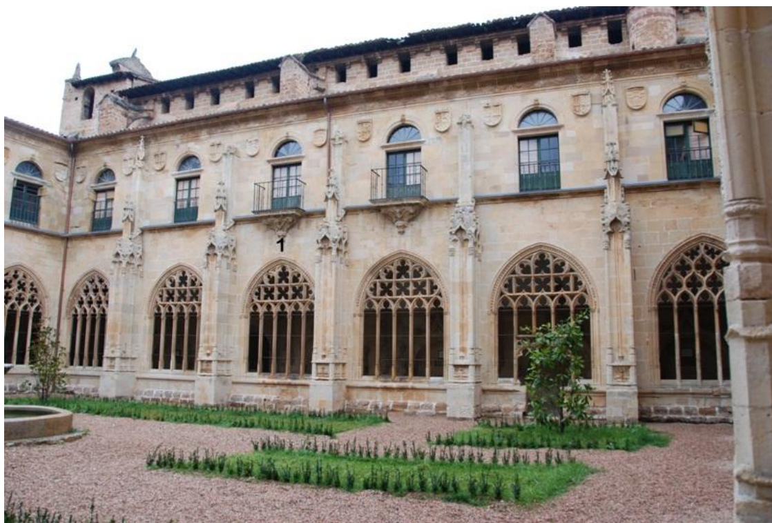
Crujía norte. Vertical declinante a poniente. Declinación: -16