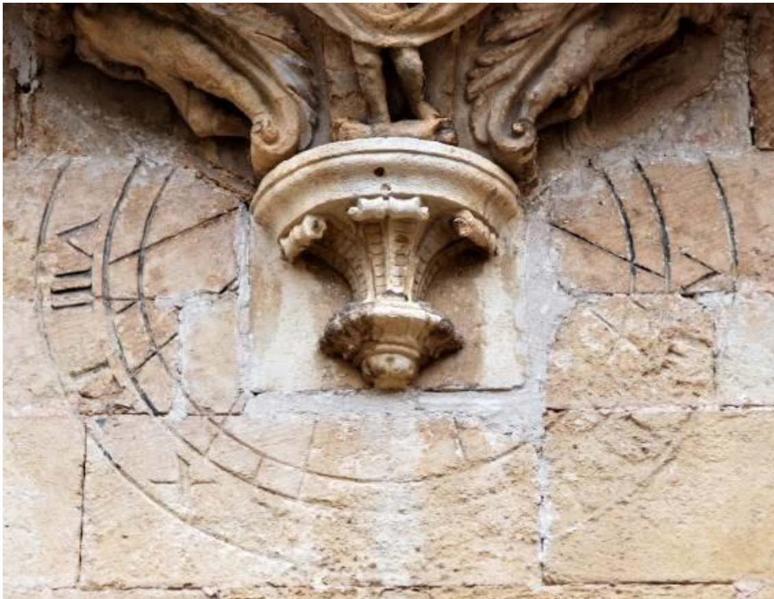
Circular grabado y pintado. Vertical declinante a poniente. Primera restauración

Otro tanto ocurre en el corte en diagonal de la repisa en el muro que se ha tenido que rellenar con varios pequeños sillares de forma triangular y rectangular. No cabe duda de que el reloj de sol estaba allí antes de edificar el segundo piso del claustro.