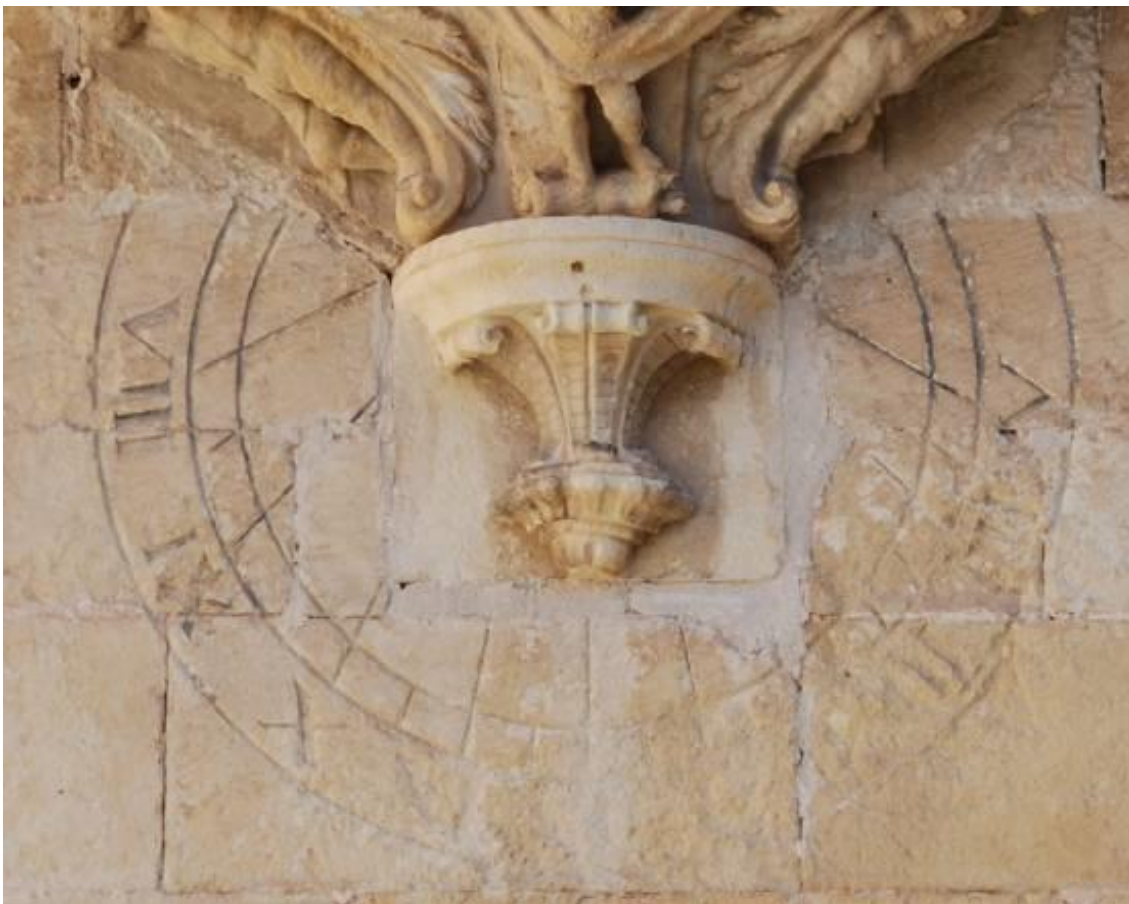
Reloj 1. Vertical declinante a poniente Segunda restauración. Año 2012