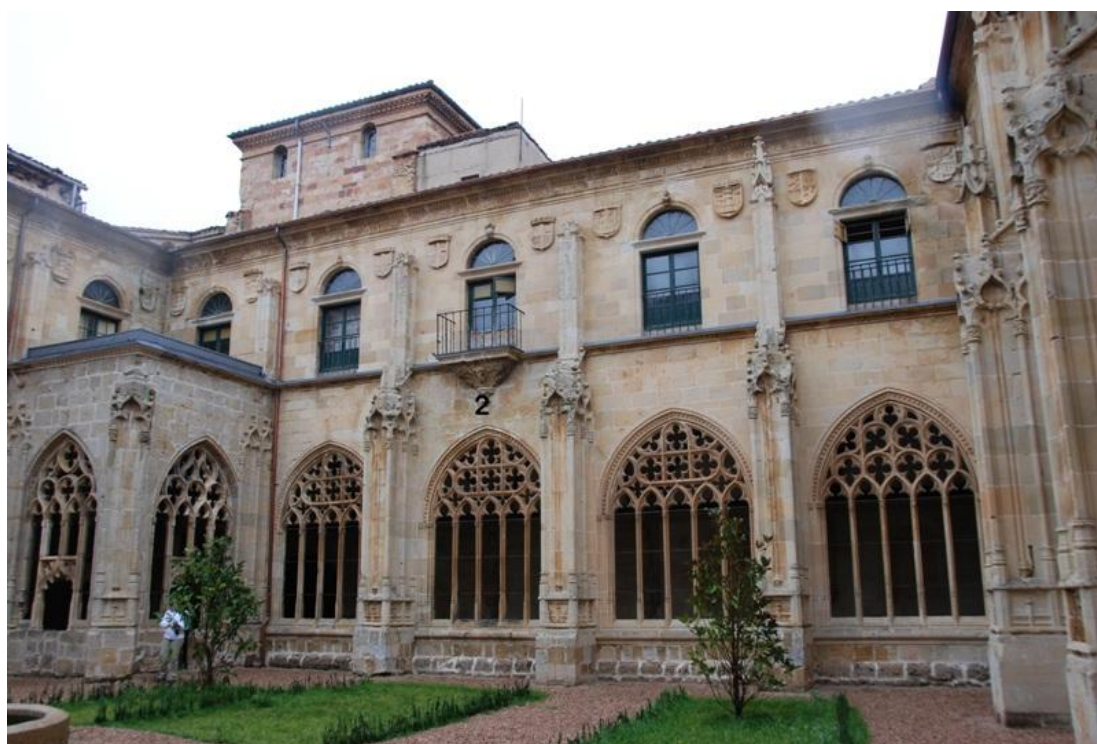
Crujía oeste. Cuadrante vertical declinante a levante. Declinación: 67. Año 2008

El primer piso del claustro de estilo gótico, atribuido a Juan de Colonia, fue edificado a principios del XVI. Tiene planta rectangular, con arcada de seis vanos en las alas norte y sur, y solamente de cinco arcos en las alas este y oeste. A finales del siglo XVII se le añadió una segunda planta. En el escudete de la clave del arco de la puerta del balcón situado sobre el reloj declinante a levante se lee una fecha: AÑO DE 1701.