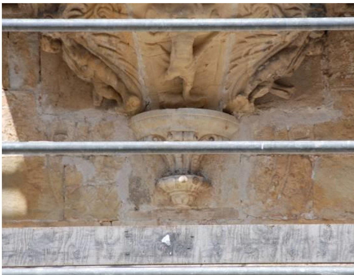
Reloj 2. Vertical declinante a levante. Obras del año 2011