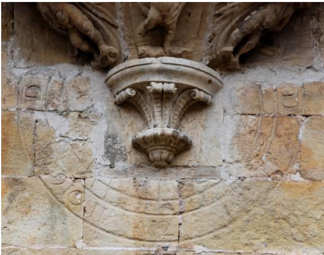
Reloj 2. Circular grabado y pintado. Vertical declinante a levante. Primera restauración

Situado bajo la repisa del balcón central del ala oeste del segundo piso del claustro. Se diferencia del anterior en la numeración: marca en números arábigos de 6 de la mañana a 12 del mediodía (las líneas horarias de la tarde han desaparecido). La utilización de números arábigos en lugar de romanos es consecuencia del reducido espacio en el que se debe escribir la numeración horaria, dada la elevada declinación a levante de la panda oeste del claustro.