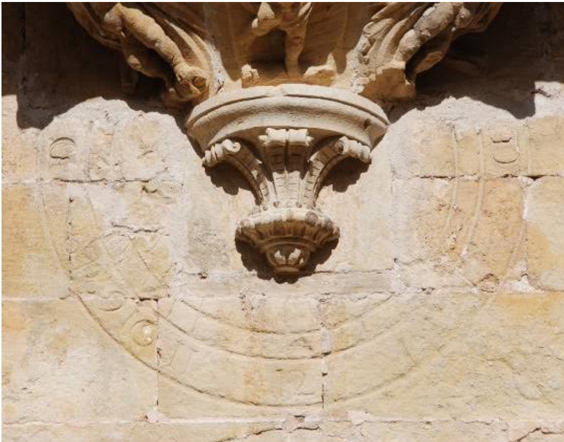
Reloj 2. Vertical declinante a levante. Segunda restauración. Año 2012