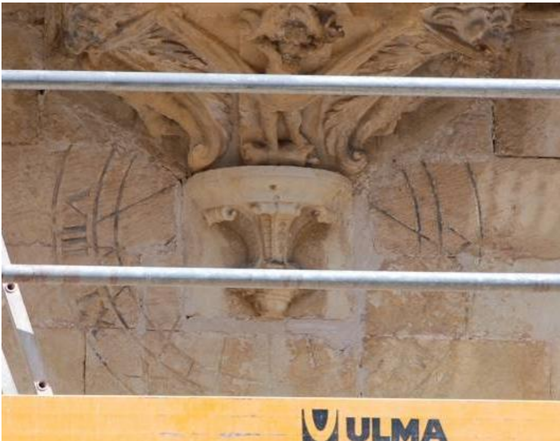
Reloj 1. Vertical declinante a poniente. Obras del año 2011.