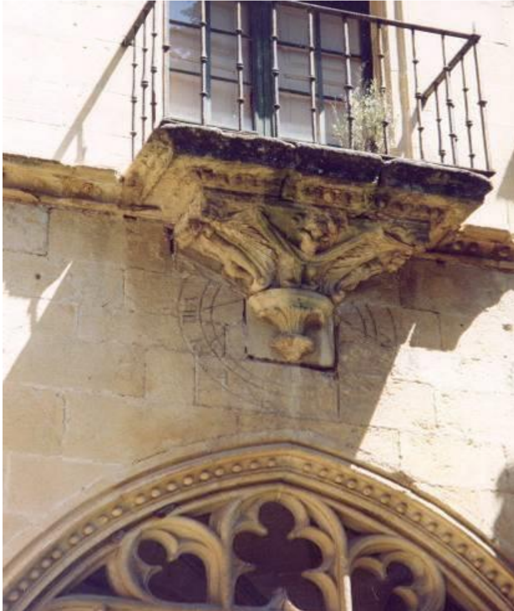
El reloj de sol del ala norte del claustro antes de la primera restauración. Año 2000

Los dos relojes de sol están grabados en el muro del claustro bajo sendos balcones del piso superior añadidos a finales del siglo XVII y principios del XVIII. La repisa del balcón da sombra al cuadrante durante casi todo el día, y las líneas horarias no están marcadas en el plano del sillar de la ménsula de la repisa, prueba de que los dos relojes de sol se grabaron antes de construir el segundo piso del claustro.